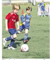
Die Junioren waren mit großer Freude dabei. MÜLLER

ROTENHOF Kennen Sie FUNino? Den Fußballern ist diese Spielform möglicherweise aus dem Training bekannt. Dabei stellt der Coach gerne mal vier kleine Tore auf, um ein bestimmtes Verhalten seiner Spieler zu provozieren.